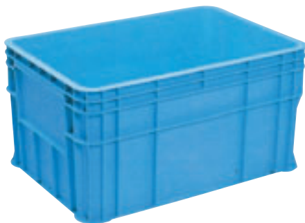
② 大型RBボックス RB-150 E-16 直