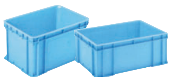
⑥ RBボックス(深型) E-16 直