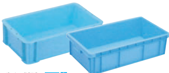
⑤ RBボックス(浅型) E-16 直