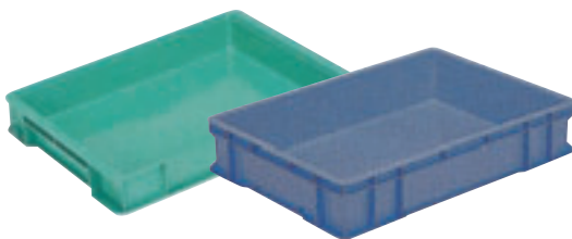
③ サンボックス(浅型) E-16 直