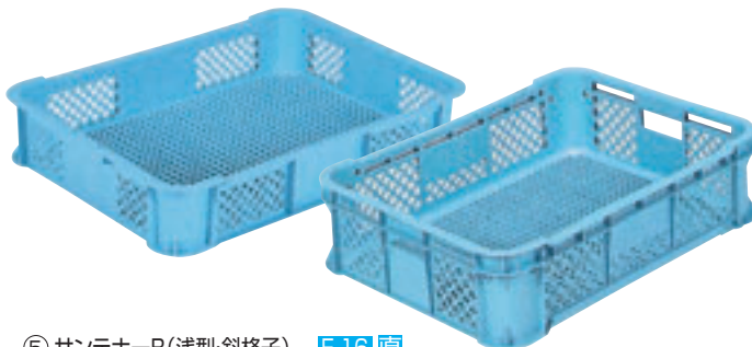
⑤ サンテナーB(浅型・斜格子) E-16 直

材質・PP(#39、#55-1、#55-2) PE(#45、#45-2、#50玉コ、#62、#150)