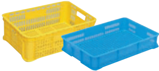
① リステナー(浅型) E-16 直