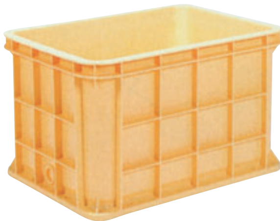
① ジャンボックス E-16 直