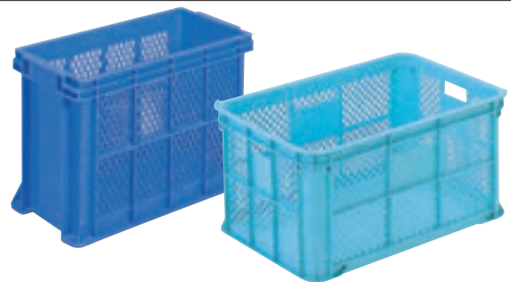
⑥ サンテナーB(深型・底面ベタ) E-16 直