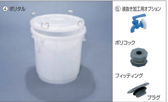
④ ポリタル E-8 直