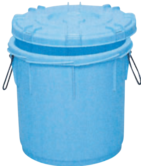
⑥ サンコータル E-16 直