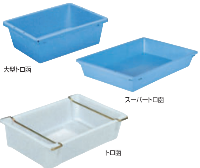
⑧ トロ函 E-16 直