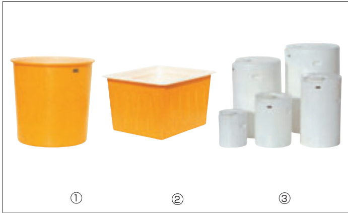
① シンタックスM E-8 直