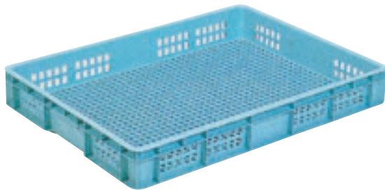
③ サンテナーB浅型 E-16 直