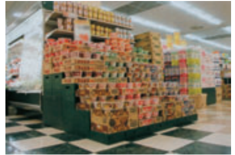
▲組み立て状態と折りたたみ状態とを組み合わせたひな壇のディスプレイ