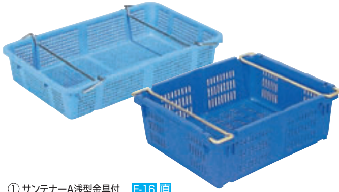
① サンテナーA浅型金具付 E-16 直 ハンドル無しあります。