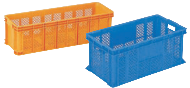
④ サンテナーB(深型・底面格子) E-16 直