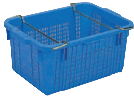
② サンテナーA深型金具付 E-16 直 ハンドル無しあります。