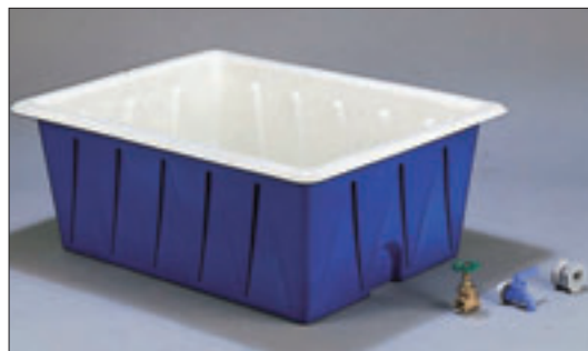
③ 塩水槽 E-8 直