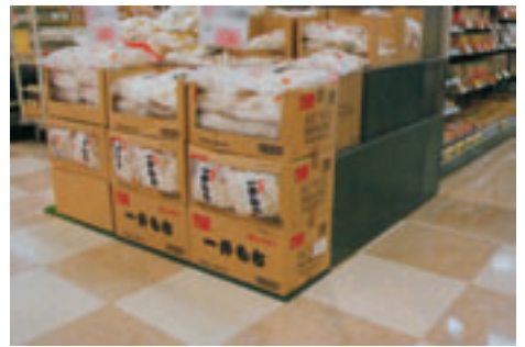
▲フタをスノコとして使用