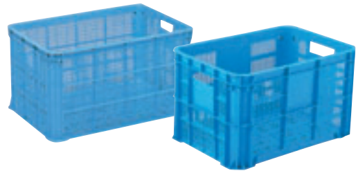
② リステナー(深型) E-16 直