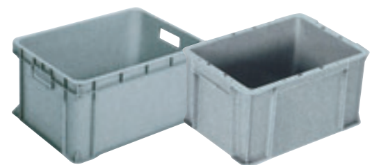
④ サンボックス(深型) E-16 直